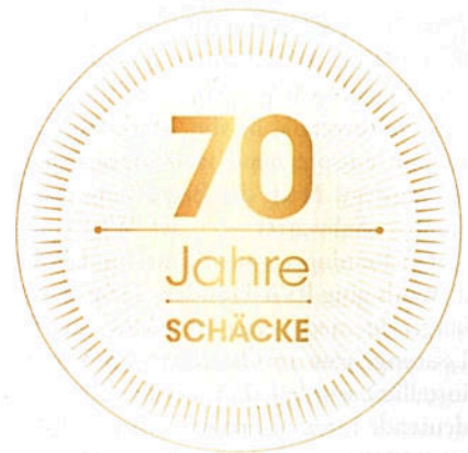
Schacke feiert 70 Jahre Marktpräsenz in Österreich – mit besonderen Kundenaktionen.

Im Rahmen der Schacke Akademie bietet der Großhändler in all seinen Niederlassungen ein umfangreiches Schulungsangebot, das auf praxisbezogene Themen abgestimmt ist. Dazu kommen einige Alleinstellungsmerkmale wie S.LB-E-Stücklisten, die SCHÄCKE App oder das elektronische Anlagenbuch comSCHÄCKE. Im Zentrum der Online-Aktivitäten steht seit mittlerweile fünf Jahren ein stets auf dem aktuellen Stand gehaltener Web-Shop, der den Arbeitsalltag der Kunden