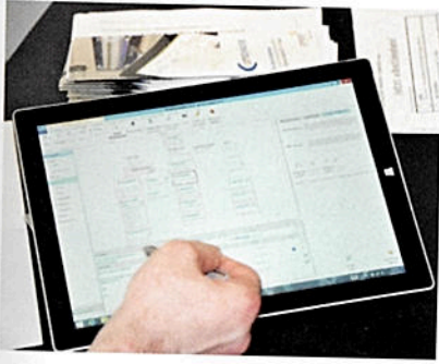
Neben Informationen rund um die Anlagenbuchsoftware comSchäcke wird es auch ein Gewinnspiel zu diesem Softwaretool geben.

Ein besonderes Highlight werden die Themeninseln auf dem Schäcke-Messestand sein: Mit diesen Info-Stationen wird auf Neuerungen in bereits bekannten und etablierten Produktsegmenten hingewiesen. Die Bereiche KNX, PV und Energieeffizienz bieten dabei die Möglichkeit, direkt mit den Experten der jeweiligen Themen in Kontakt zu kommen und sich Informationen aus »erster Hand« abzuholen. Auch die Info-Station zum Thema Licht soll großes Interesse wecken. Hier hat sich Schäcke in den letzten Monaten komplett neu aufgestellt und bietet den Kunden neue Möglichkeiten und besondere Dienstleistungen an.