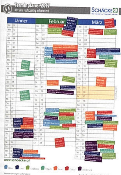
Der Schäcke-Terminplaner 2017 gibt einen Überblick über die Aktivitäten der Schäcke-Akademie im gesamten ersten Halbjahr 2017.

Ein besonderes Highlight werden die Themeninseln auf dem Schäcke-Messestand sein: Mit diesen Info-Stationen wird auf Neuerungen in bereits bekannten und etablierten Produktsegmenten hingewiesen. Die Bereiche KNX, PV und Energieeffizienz bieten dabei die Möglichkeit, direkt mit den Experten der jeweiligen Themen in Kontakt zu kommen und sich Informationen aus »erster Hand« abzuholen. Auch die Info-Station zum Thema Licht soll großes Interesse wecken. Hier hat sich Schäcke in den letzten Monaten komplett neu aufgestellt und bietet den Kunden neue Möglichkeiten und besondere Dienstleistungen an.