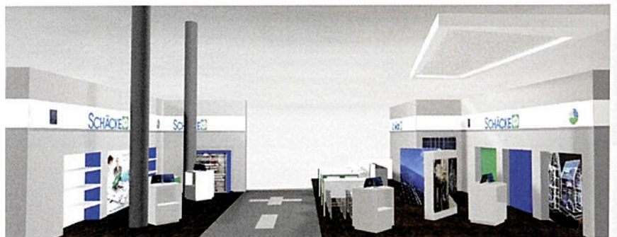
Auf 150 m 2 (Stand o612 und o614 in der Halle 10) informiert Schacke über die Neuheiten seines Produkt- und Leistungsspektrums.

11.000 Euro: Darunter gibt es ein Schulungspaket der Schacke Akademie im Wert von 1.200 Euro zu gewinnen, S.LB-E, comSchacke und CAD-Lizenzen oder auch ein comSchacke-kompatibler CA6117 Anlagentester mit Schnittstelle zur comSchacke-Anlagenbuchsoftware.